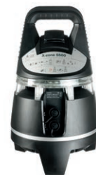
Dräger X-zone® 5500 Вид спереди