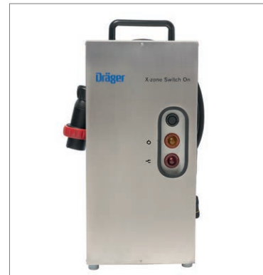
Dräger X-zone® Switch On