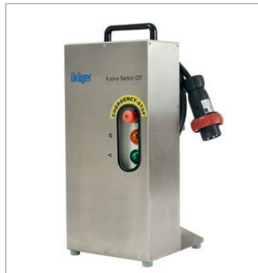
Dräger X-zone® Switch Off

Дополнительные устройства Switch On и Switch Off – быстрый, недорогой и удобный способ повысить безопасность при работах во взрывоопасной зоне 1. В случае тревоги коммутационная станция Switch Off за доли секунды автоматически отключит электропитание подключенной нагрузки, например, сварочного аппарата. Коммутационная станция Switch On в случае опасности мгновенно включит подключенную нагрузку, например, светофор, управляющий въездом в рабочую зону, или систему вентиляции. Соответствующая коммутационная станция просто подключается к Безпотенциальному сигнальному контакту Dräger X-zone 5500.